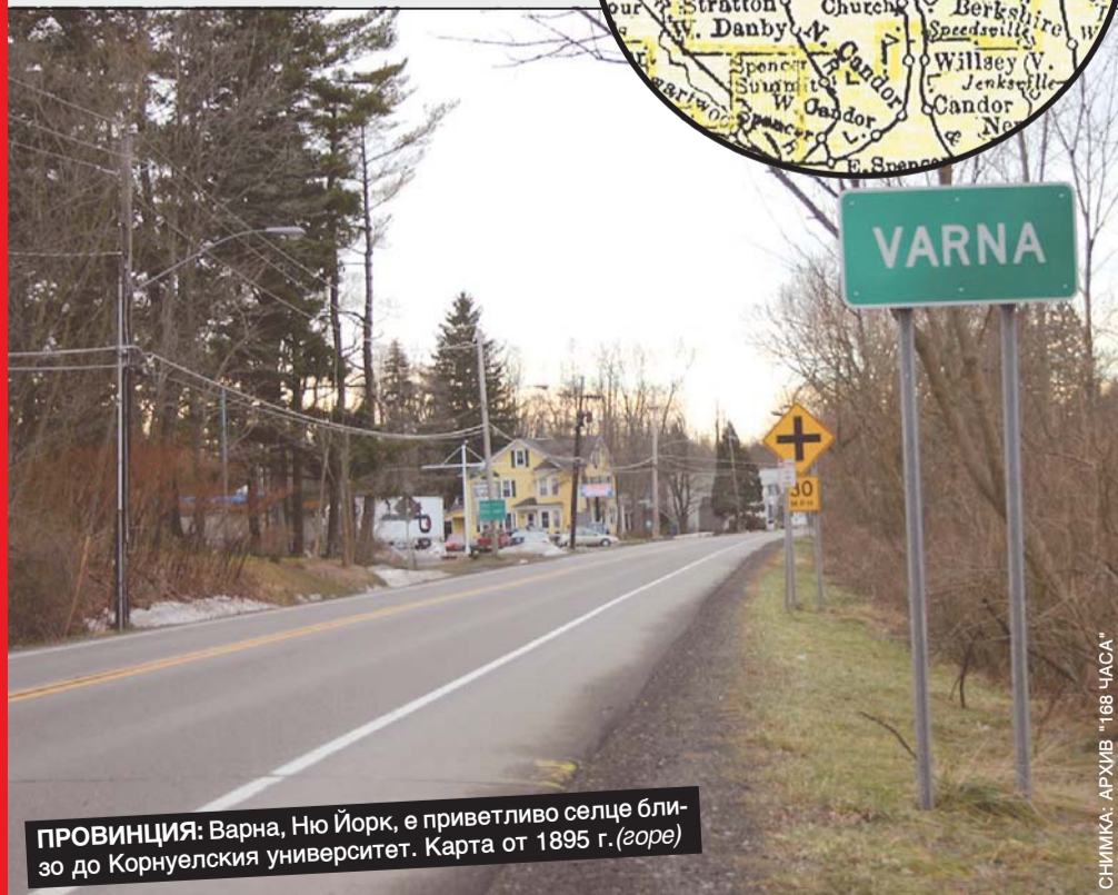
ПРОВИНЦИЯ: Варна, Ню Йорк, е приветливо селце близо до Корнуелския университет. Карта от 1895 г. (горе)

„Н ЯМАМ идея откъде произхожда името на селото ни, нито кой го е основал, но получаваме адски много фалшиви имейли от България, в които ни искат пари.