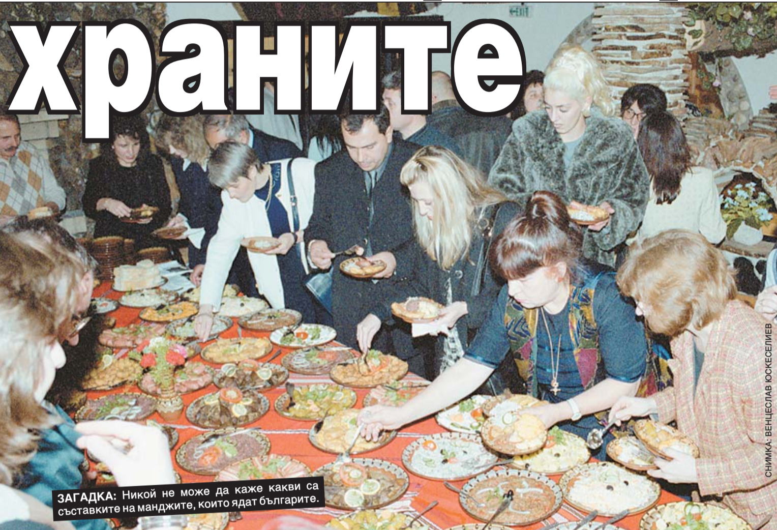
ЗАГАДКА: Никой не може да каже какви са съставките на манджите, които ядат българите.